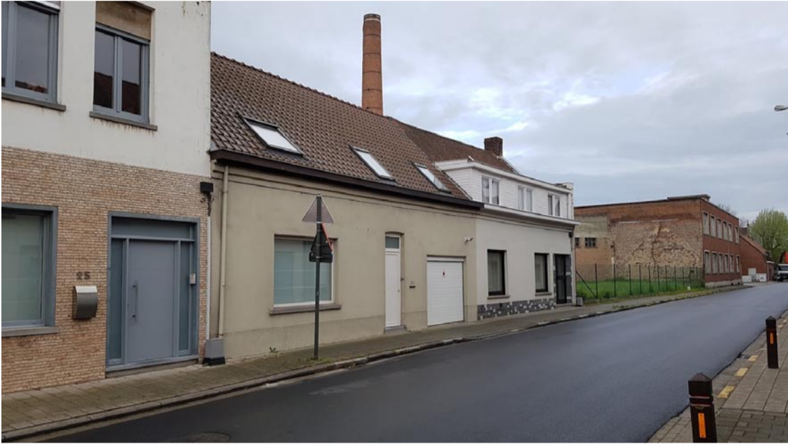
De Casino anno 2019 met op de achtergrond de schoorsteen van de firma Masureel.