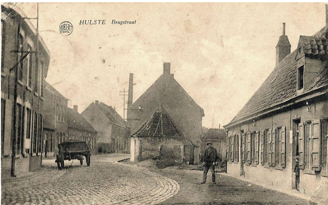
Zicht op het begin van de Brugsestraat. Café De Casino zie je hier op de achtergrond, rechts achter de boerenkar. De huisjes rechts op de voorgrond zijn nu het zakenkantoor Kerckhof en Six.